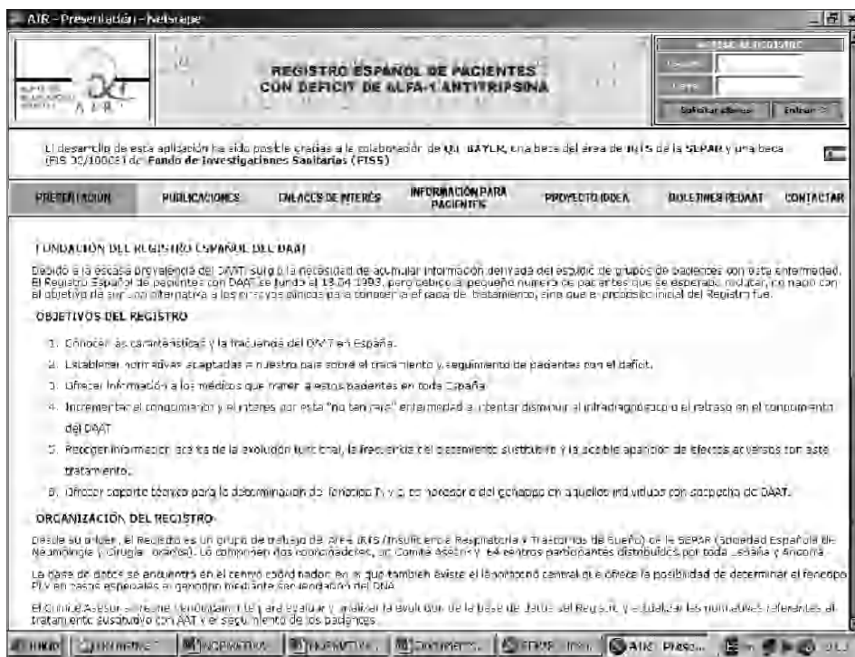
Fig. 3. Página inicial del Registro Español de pacientes con déficit de alfa-1-antitripsina. Disponible en: http://db.separ.es/cgi-bin/wdbegi.exe/separ/air.baseline_pack_3.indice?p_origen=34

a publicaciones. También existen links con otras webs médicas y de asociaciones de enfermos. El registro de pacientes se realizará mediante acceso personal. Para ello solicitaremos claves y en unos días recibiremos “usuario” y “clave” para nuestro acceso personal (tabla IX y fig. 3).